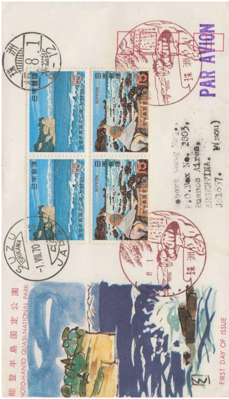
Dette er et eksempel på en første dags kuvert med stempler brugt for Noto Hanto (Noto halvø) park sendt fra SUZU i Ishikawa prefektur. Nederst to SUZU landskabsstempler (først brugt 207-1965) i japansk tidsregning 45.8.1 (1/8-1970) med posthuset navn på japansk. Stemplet viser Mitsuake øen og Iida bugten i baggrunden. I forgrunden et fyrretræ, en svamp og monument med et digt. Øverst til højre er et indenrigs brotypestempel med en due, som tegn på at det er første dag. Øverst til højre er et swordguard stempel SUZU Ishikawa 1/8-1970 med en due. Et swordguard stempel fra SUZU er kun kendt for denne ene dag.