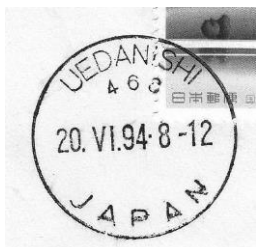
Normalt ringstempel med månedstal uden serif.

Nogle gange overses at et stempel er anderledes end normalt, når forskellen er ganske minimal. Jeg fik en liste fra et medlem af ISJP med nye første og sidste datoer for brug af ringstempler. Her var nævnt, at nogle stempler havde månedsnumre i form af romertal angivet med serif. Serifs er en kort vandret line i toppen af et tegn for at gøre det lettere læseligt. Skriften her er med serif. Men det ses bedst ved at sammenligne to stempler: